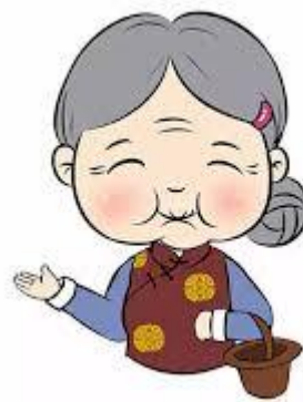
奶奶 [nǎinai] คุณย่า