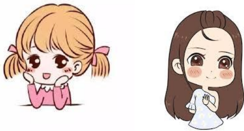
女儿 ( nǚér ) ลูกสาว