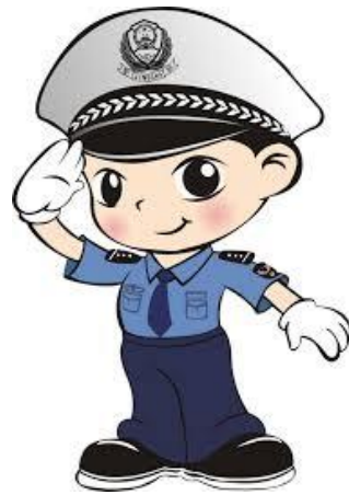
叔叔 [shūshu] คุณอา