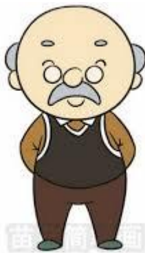
爷爷 [yéye] คุณปู่