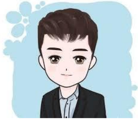
哥哥 (gēge) พี่ชาย