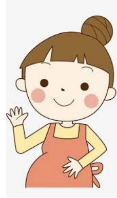
妈妈 ( māma ) คุณแม่