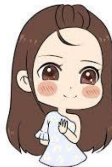
姐姐 ( jiějie ) พี่สาว