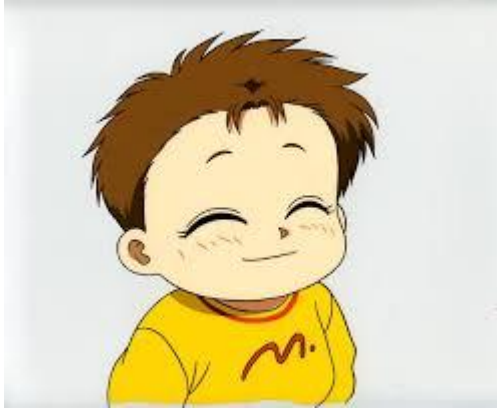
弟弟 [dìdì] น้องชาย