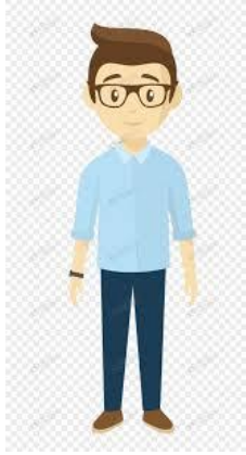
爸爸 ( bàba ) คุณพ่อ