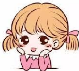
妹妹 ( mèimei ) น้องสาว