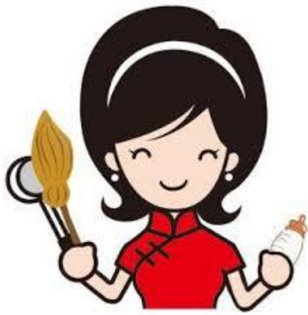
阿姨 [āyí] คุณน้า