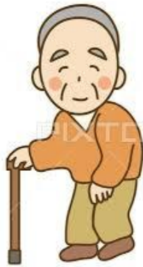
外公 [wàigōng] คุณตา