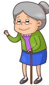
外婆 [wàipó] คุณยาย