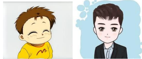
儿子 ( érzi ) ลูกชาย