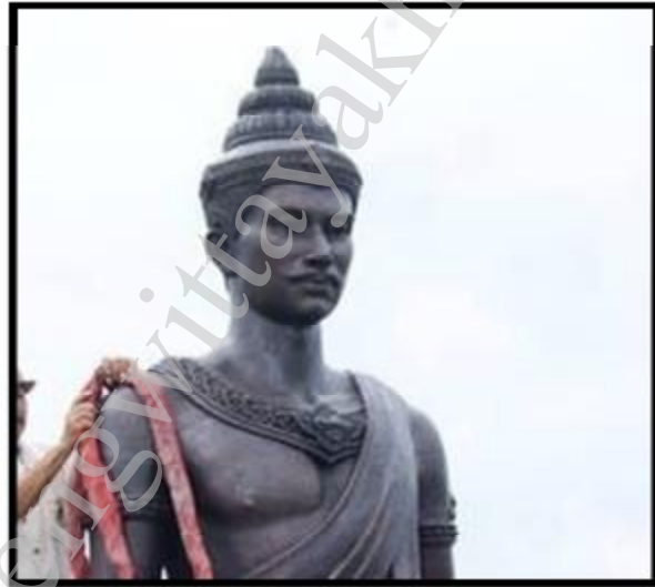
อนุสาวรีย์พ่อขุนศรีอินทราทิตย์ ที่บ้าน

พระนามเดิมของพ่อขุนศรีอินทราทิตย์ คือ พ่อขุนบางกลางหาวได้ร่วมมือกับพระสหาย คือ พ่อขุนผาเมืองเจ้าเมืองราชมกษัตริย์คน ไทยทำสงครามขับไล่เขมรพ่อขุนบางกลางหาวได้เสวยราชย์ เป็นกษัตริย์ครองกรุงสุโขทัย ทรงพระนามว่า พ่อขุนศรีอินทราทิตย์ ต้นราชวงศ์พระร่วง มีพระมเหสีชื่อ นางเสือง มีพระราชโอรสและพระราชธิดา 5 พระองค์