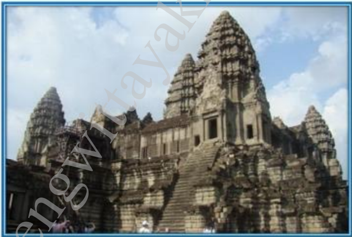
มหาปราสาทในนครวัด

1. ปัจจัยภายนอก การเสื่อมอำนาจของอาณาจักรขอมมีมูลเหตุที่สำคัญ คือ ความสูญเสียจากการทำสงครามยืดเยื้อกับอาณาจักรจัมปาและอาณาจักรไคเวียด และความสิ้นเปลืองจากการทุ่มเทสร้างเทวสถานขนาดใหญ่และสร้างสาธารณูปโภคต่างๆ