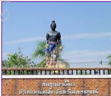
อนุสาวรีย์พ่อขุนผาเมือง

สุโขทัยอยู่ในทำเลที่เหมาะสม เมืองสุโขทัยตั้งอยู่บนที่ราบเชิงเขาที่ลาดมาบรรจบกับที่ราบไม่ไกลจากแม่น้ำยม พื้นดินมีความอุดมสมบูรณ์พอที่จะทำการเกษตร และมีทางคมนาคมสะดวก อยู่ห่างไกลจากศูนย์กลางอำนาจทางการเมืองของเขมร