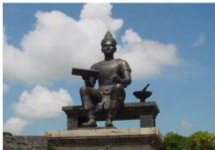
อนุสาวรีย์พ่อขุนรามคำแหงมหาราช