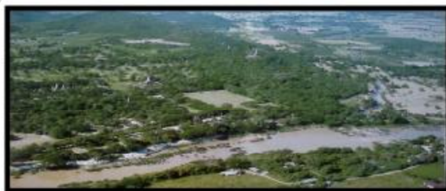
ภาพถ่ายเมืองศรีสาขาลัย

2. เมืองสุโขทัย ศูนย์กลางตั้งอยู่ที่วัดพระพายหลวงฝั่งเมืองเก่าในรูปสี่เหลี่ยม มีคูน้ำล้อมรอบ มีการสร้างศาสนสถานขึ้นตามความเชื่อของพุทธศาสนานิกายมหายานเป็นพระปรารักษ์สามองค์ นอกจากนี้ยังพบว่าบริเวณวัดพระพายหลวงแห่งนี้เคยเป็นชุมชนโบราณที่ตั้งอยู่ก่อนการสร้างเมืองสุโขทัย ก่อทางด้านทิศใต้มีศาสนสถานสำคัญอยู่ 2 แห่งคือ วัดศรีสวยและวัดศาลาตามาตลง ล้อมมาได้มีการย้ายมาสร้างเมืองสุโขทัยใหม่ทางทิศใต้ซึ่งมีชัยภูมิใหม่ที่เหมาะกว่าโดยขุดคูเมืองและสร้างกำแพง 3 ชั้น ดังมีจารึกว่า “รอบเมืองสุโขทัยนี้ตรีบูรได้สามพันสี่ร้อยกว่า” มีโบราณสถานสำคัญมากมายเช่น พระราชวัง วัดมหาธาตุ และวัดศรีชุมอยู่นอกกำแพงเมือง เป็นต้น