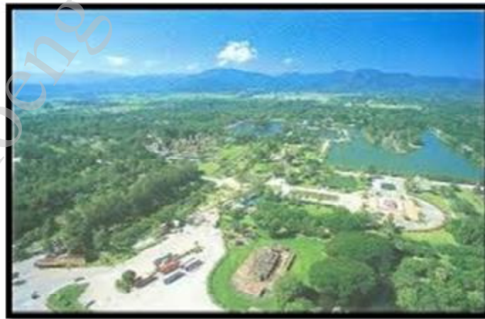
ภาพถ่ายเมืองสุโขทัย ที่มา http://www.thaigoodview.com

ตั้งนั้นครั้นเมื่อพ่อขุนศรีนาวนำถมสิ้นพระชนม์ลง จึงเป็นเหตุให้ชนชาติเขมรที่อาศัยอยู่ในเมืองสุโขทัยซึ่งมีตำแหน่งเป็นเพียงโฆลญล่ำพงได้รวบรวมกำลังพรรคพวกตนยึดเมืองสุโขทัยไว้ได้ นับเป็นการสิ้นสุดอำนาจทางการเมืองปกครองของพ่อขุนศรีนาวนำถม