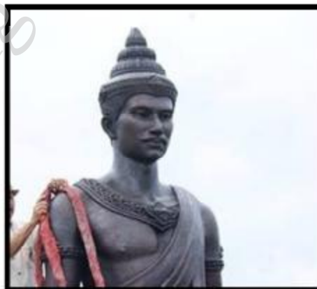
อนุสาวรีย์พ่อขุนศรีอินทราทิตย์

พ่อขุนผาเมืองเป็นเจ้าเมืองราด พระราชโอรสของพ่อขุนศรีน่านำลูกซึ่งได้อภิเษกสมรสกับนางสุขรมหาเทวีพระราชธิดาของกษัตริย์ขอมและได้รับพระราชทานพระแสงขรรค์ชัยศรีเป็นเครื่องแสดงอำนาจอาญาสิทธิ์และได้รับพระราชทานนามจากกษัตริย์ขอมว่า กมรเตง อัญสรีย์อินทรบดินทราทิตย์ ได้ร่วมมือกับพ่อขุนบางกลางหาวเจ้าเมืองบางยางพระสหาย พร้อมด้วยประชาชนผู้กล้าหาญของชาติไทยได้ร่วมกันนำกำลังคนไปรบขับไล่ขอมสบาดโขลญลำพงออกไปจากเมืองสุโขทัยได้สำเร็จในปี พ.ศ. 1781 แต่ด้วยเหตุที่พ่อขุนผาเมืองมีนพหุสีเป็นพระธิดาของกษัตริย์เขมรแม้จะทำการชิงอำนาจได้ ก็เกรงขัดศรหาว่าขุนผาเมืองนั้นชิงอำนาจกลับไปให้กษัตริย์เขมรคือพระเจ้าชัยวรมันที่ 7 ดังนั้นจึงพระราชทานพระแสงขรรค์ชัยศรีและพระนามที่ได้รับจากกษัตริย์เขมรมแก่พ่อขุนบางกลางหาวและสถาปนาขึ้นครองราชย์ใน พ.ศ. 1792 เป็นปฐมกษัตริย์พระองค์แรกแห่งราชวงศ์พระร่วง ทรงพระนามว่า “พ่อขุนศรีอินทราทิตย์”